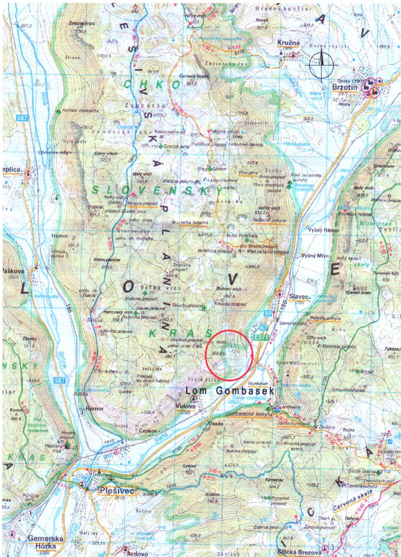
SITUAČNÝ PLÁN ŠIRŠIEHO OKOLIA M=1:50 000