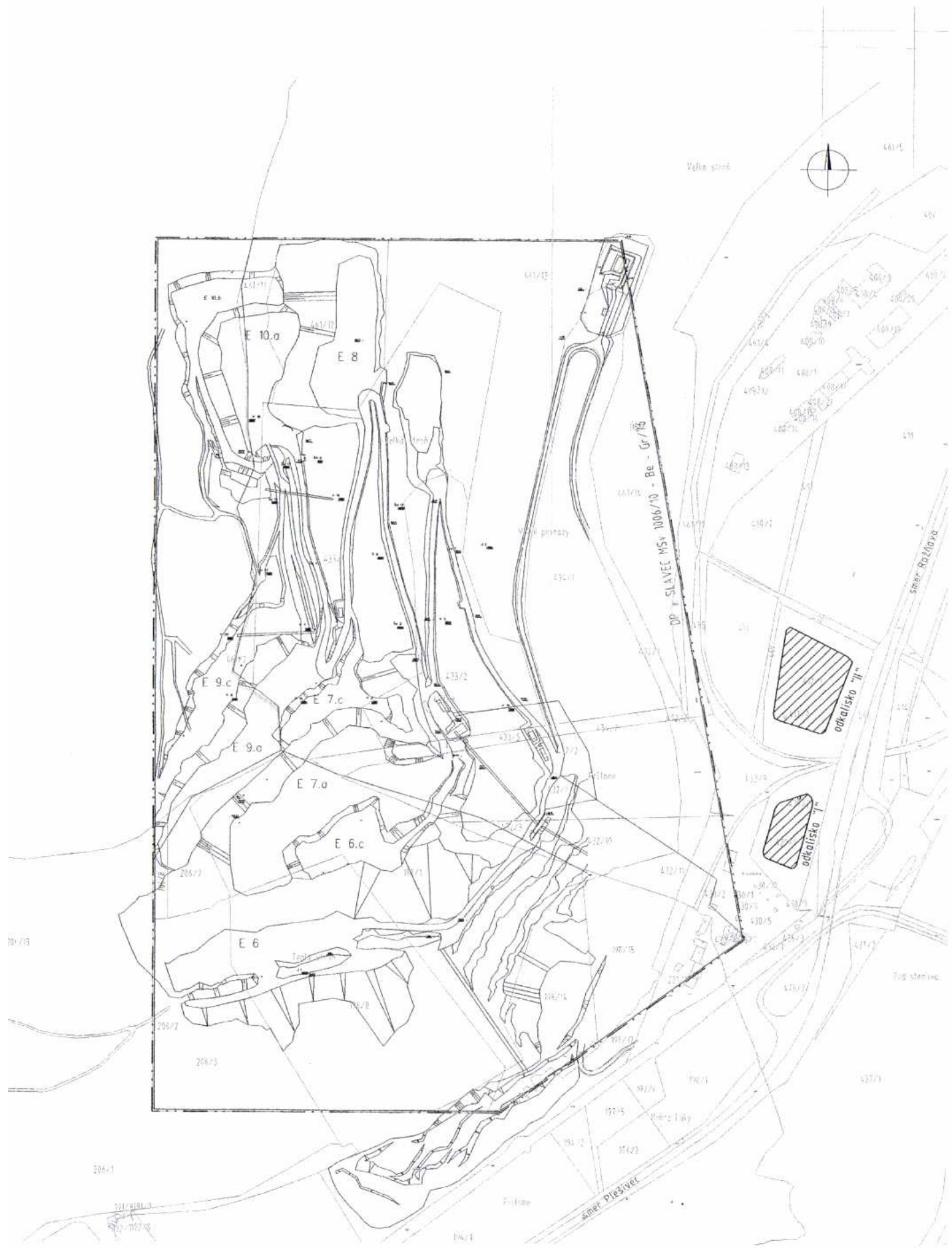
SITUÁČNÝ PLÁN ROZMIESTNENIA ÚLOŽISK M=1:5 000

ORGANIZÁCIA: Cameuse Slovakia s.r.o. Slavec